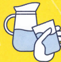
BUVEZ DE L'EAU