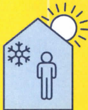
RESTEZ AU FRAIS